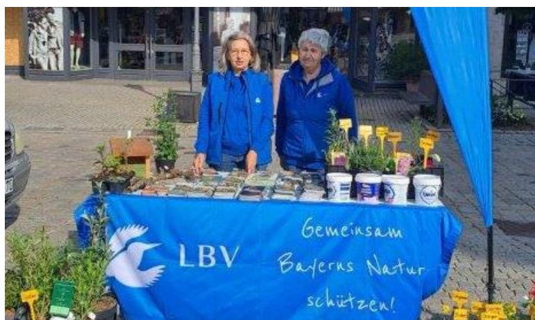
Neustädter Bauernmarkt Infostand Insektenfreundliche Balkonpflanzen