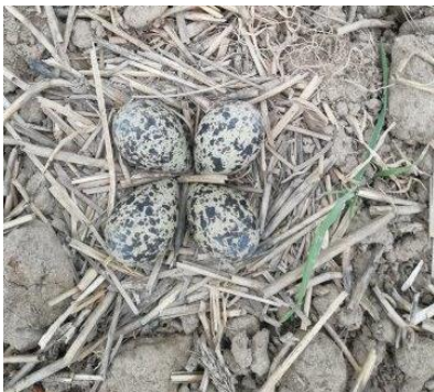
Links: Eier und Jungvogel, Fotos M. Loscher;