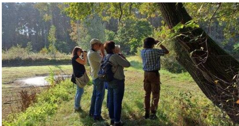
3. Oktober Birdwatch bei Gottesgab