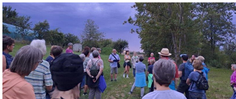
24. August Weinhähnchen-Führung Reusch