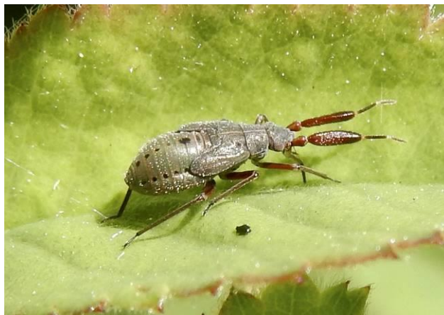
20.06.2022 Erstfund bei Bad Windsheim, 16.06.2023 Bestätigung