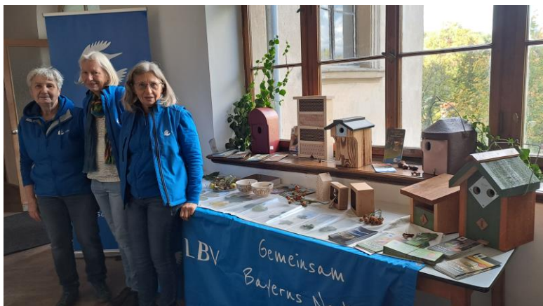
15. Oktober Holztag Scheinfeld