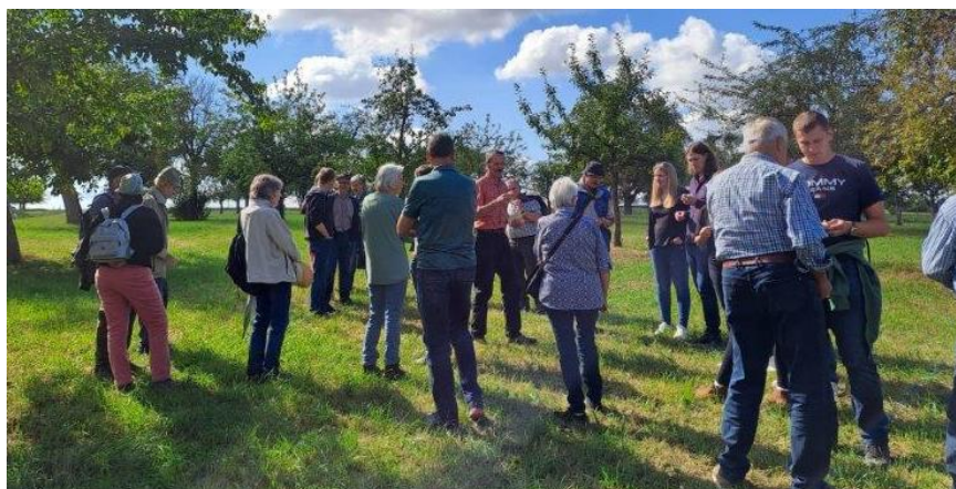
24. September Obstsortenführung Geckenheim