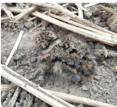
rechts erwachsener Kiebitz, Foto Paul Graf.