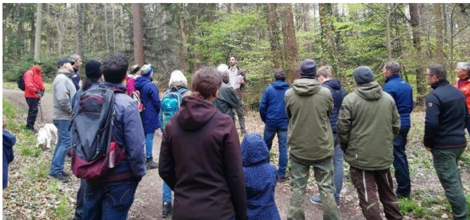
29. April Wald im Umbau