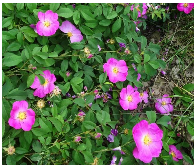
10.06.2023 am Osing: Jungtier (so genannte „Nympe“) und Essigrose